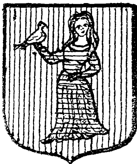
Escudo de la ciudad GOLUB - DOBRZYŃ

La pequeña pero muy antigua ciudad de Golub-Dobrzyń está ubicada sobre el río Drwienca a unos treinta kilómetros de la ciudad de Toruń, lugar de nacimiento de Nicolás Copérnico. Conocida ya en 1250, Golub fue rodeada por murallas, cuyos restos existen aún, cuando recibió los derechos municipales en el principio del siglo XIV. A la misma época pertenece el magnífico castillo gótico, remodelado ligeramente en el siglo XVII y enriquecido con un ático renacentista cuando servía de residencia a la princesa Ana, hermana del rey Segismundo III. Allí tenían lugar, en el Medioevo, torneos caballerescos, cuya tradición es mantenida hasta hoy. Anualmente, en el mes de julio, el castillo se llena de caballos y caballeros acorazados que miden su destreza y fuerzas en duelos a la